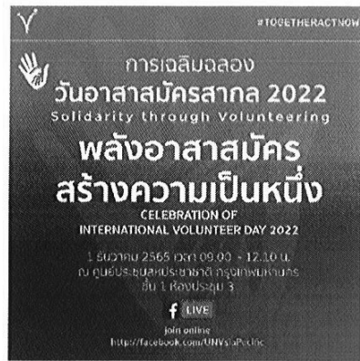
แบบที่ ๑ โปสเตอร์ประชาสัมพันธ์กิจกรรมของ UNV