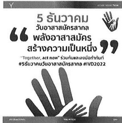
แบบที่ ๒ โปสเตอร์ประชาสัมพันธ์กิจกรรมของหน่วยงาน